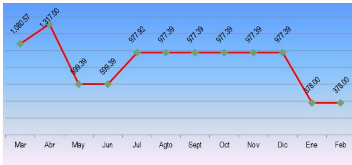
Ilustración 1. Curva estadística de ingreso mensual de ACPM al Almacén del Batallón.

De la información anterior se evidencia que el contratista ESTACIÓN DE SERVICIO EL PROGRESO WALTER había suministrado al Batallón BITER 22, a partir del inicio del contrato de suministro (9 de marzo/16) y hasta el 28 de febrero de 2017 la cantidad de 10.217,22 galones de ACPM y 27 galones de aceite 15W40, y con referencia a los precios fijados en el contrato equivalen a los siguientes montos o valores: