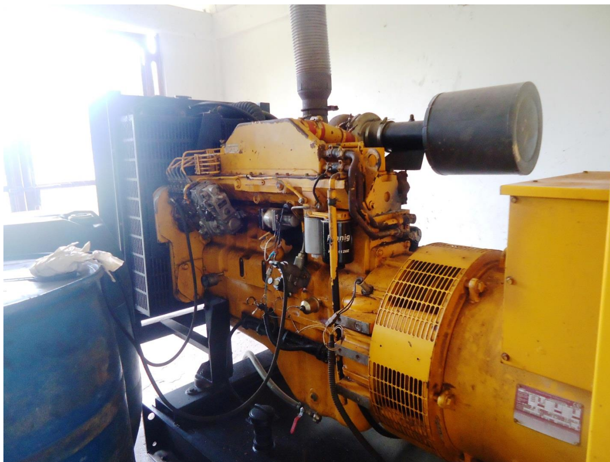
Ilustración 2. Planta eléctrica Cummins instalada en el BITER 22

La planta generadora de energía eléctrica instalada en el Batallón BITER 22 presenta las siguientes características: